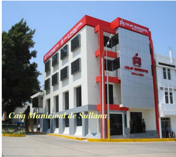
Caja Municipal de Sullana