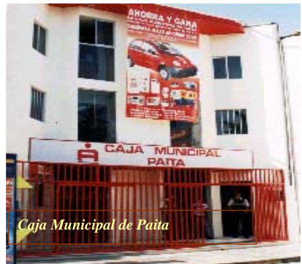
Caja Municipal de Paíta

De esta manera se puede afirmar que las CMACs de la Región en referencia, dada su eficiencia, rentabilidad y confianza ganada a lo largo de sus años de funcionamiento, constituyen un valioso aporte en la lucha contra el desempleo y la pobreza y contribuyen a mejorar la calidad de vida de un gran sector de la población; ya que canalizan sus recursos financieros al sector de los micro y pequeños empresarios, quienes usualmente tienen muchas trabas para acceder al sistema crediticio.