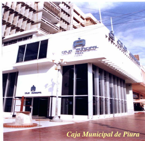
Caja Municipal de Piura