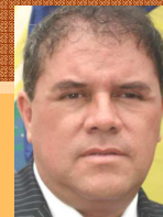
LOVELL YOMOND VARGAS Alcalde distrito de Independencia Lima Norte

En el marco de la estrategia nacional Crecer, la municipalidad ha implementado en esta zona una "Casa Crecer", donde brindan servicio los programas municipales: DEMUNA, OMAPED, policlínico y el Wawawasi. Se espera que ahora el gobierno central articule con todos los sectores para la atención integral de esta población.