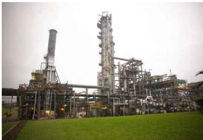
Figura N° 1. Refinería la Pampilla - Ventanilla

La empresa más representativa y de gran dimensión en la actividad industrial es Refinería La Pampilla S.A. (Relapasa),