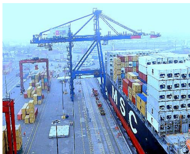
Figura N° 2. Grúa portica – Puerto del Callao

En tanto, en el 2011 se dio la concesión del Muelle Norte a APM Terminals, también por 30 años, donde se prevé una inversión de S/. 243 millones en la primera etapa de modernización de ese sector del puerto 8 .