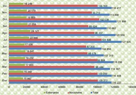
GRÁFICO N° 3 REGIÓN ICA: PERNOCTACIONES DE TURISTAS EXTRANJEROS Y NACIONALES, 2011

Nota: Datos obtenidos en el mes de marzo 2012.