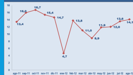
GRÁFICO N° 03 CIUDADES DE PUNO Y JULIACA: VARIACIÓN ANUAL DEL EMPLEO EN EMPRESAS PRIVADAS FORMALES DE 10 Y MÁS TRABAJADORES, AGOSTO 2011 - AGOSTO 2012 (Porcentaje)

Nota: La variación anual mide la variación porcentual del empleo en el mes indicado respecto al mismo mes del año anterior.