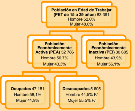
GRÁFICO N° 1 REGIÓN TACNA: DISTRIBUCIÓN DE LA POBLACIÓN JUVENIL SEGÚN CONDICIÓN DE ACTIVIDAD, 2010

Respecto al mercado laboral tacneño, la población juvenil se compone de 52 mil 786 jóvenes, de los cuales 56,7% son hombres y 43,3% son mujeres; mientras que la población en condición de inactivos 6 , es de 30 mil 605 personas siendo mayor el porcentaje de las mujeres (56,1%) respecto a los hombres (43,9%). Asimismo, la PEA juvenil ocupada alcanzó a 47 mil 181 frente a 5 mil 605 desocupados.