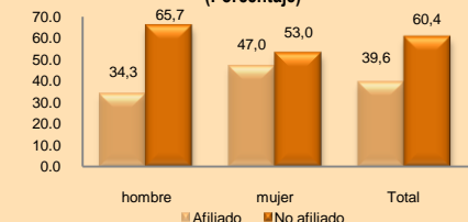
GRÁFICO Nº 3 REGIÓN TACNA: PEA OCUPADA JUVENIL POR SEXO SEGÚN AFILIACIÓN AL SEGURO SOCIAL DE SALUD, 2010 (Porcentaje)