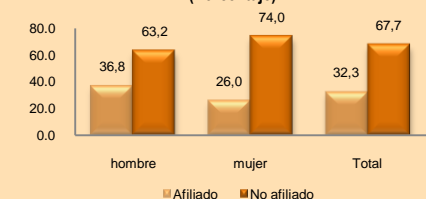
GRÁFICO Nº 4 REGIÓN TACNA: PEA OCUPADA JUVENIL POR SEXO SEGÚN AFILIACIÓN AL SISTEMA DE PENSIONES, 2010 (Porcentaje)