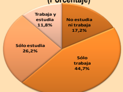
GRÁFICO Nº 5 REGIÓN TACNA: PET JUVENIL, SEGÚN CONDICIONES DE TRABAJO Y ESTUDIO, 2010 (Porcentaje)

Fuente: INEI- Encuesta Nacional de Hogares sobre Condiciones de Vida y Pobreza, continua 2010. Elaboración: DRTPE - Observatorio Socio Económico Laboral (OSEL) Tacna.