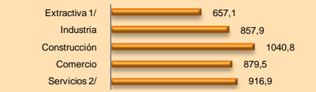
GRÁFICO N° 2 REGIÓN TACNA: PEA JUVENIL OCUPADA, SEGÚN INGRESO PROMEDIO MENSUAL POR RAMA DE ACTIVIDAD ECONÓMICA, 2010

Respecto al ingreso promedio mensual, los jóvenes ubicados en la rama de actividad económica construcción perciben un mayor ingreso (S/.1 040,8) seguido de la rama de actividad económica servicios (S/. 916,9).